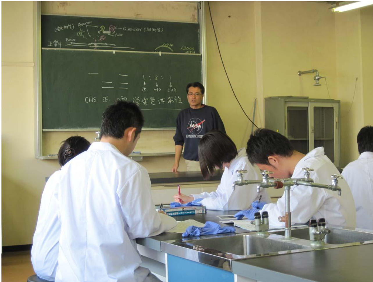
【講座①】ウシのチェディアック・東症候群の遺伝子診断 ウシのチェディアック・東症候群について講義を受けている様子。