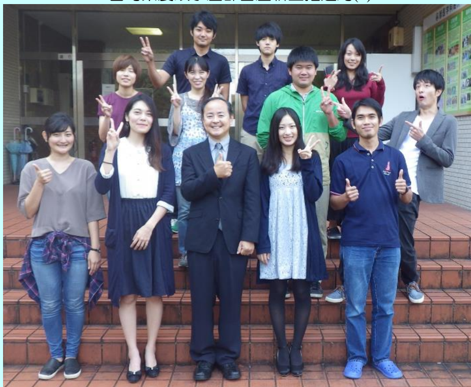
平成二十九年度 農学部 獣医学科 末吉研究室

北海道大学獣医大学院(1) 大分県家畜保健衛生所(1) 宮崎県農政水産部畜産新生推進局(1)