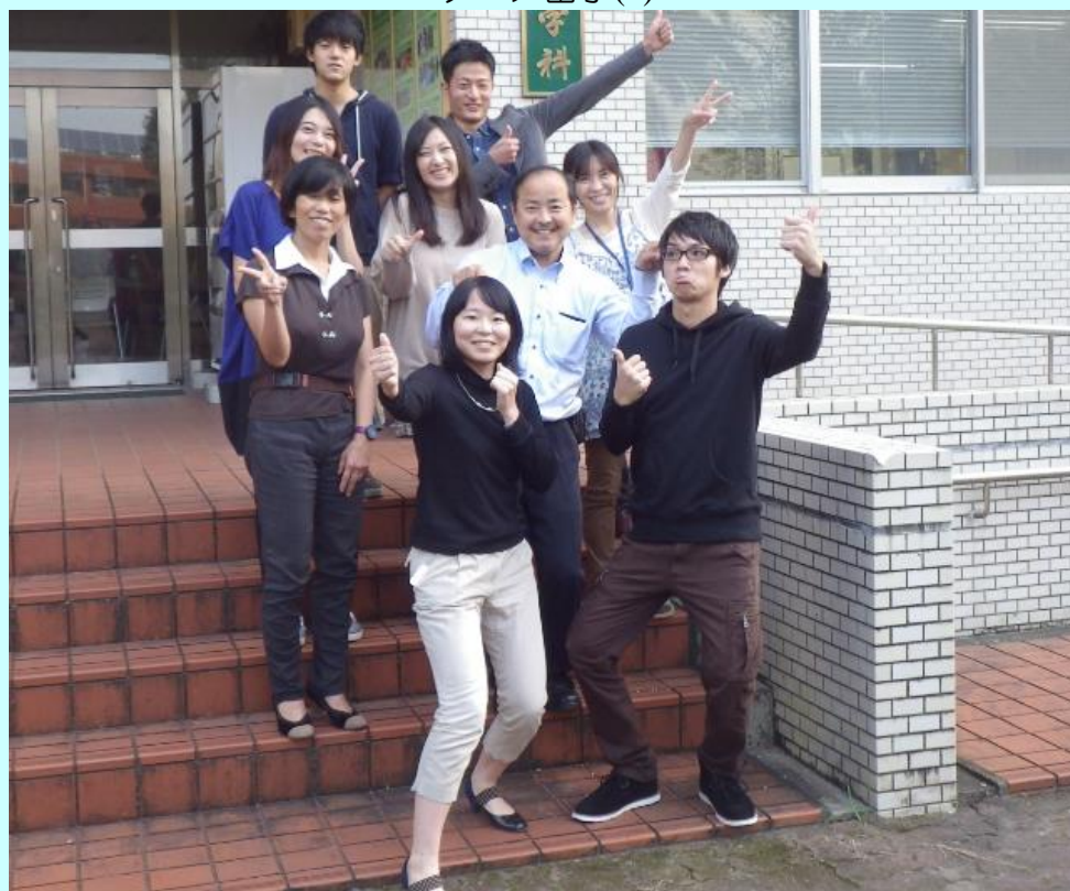
平成二十七年度 農学部 獣医学科 産業動物衛生学